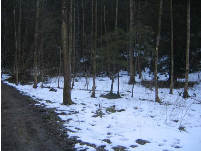
Foto Nr. 19: Bestehender Bruchwald: Auslichten und Anlage einzelner flacher Mulden und Tümpel