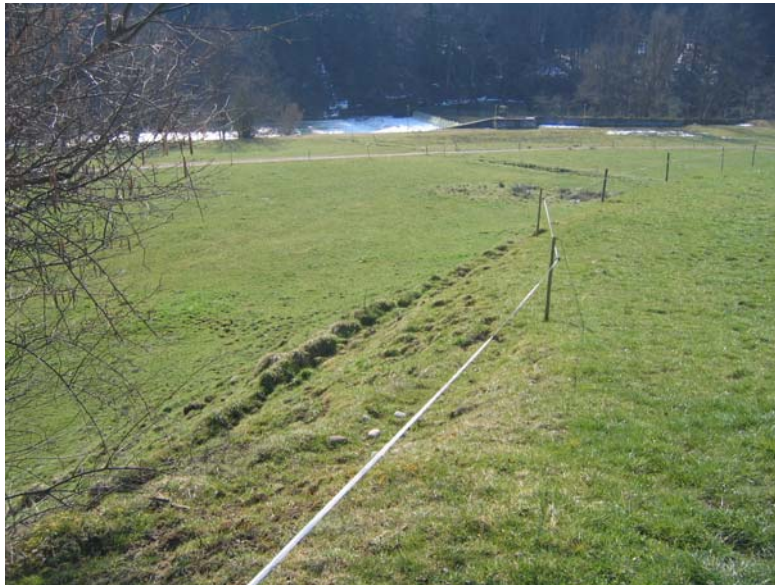
Foto Nr. 34: Steile Wiesenböschung, geeignet zur Extensivierung als Magerstandort; in der Ebene Ausscheidung einer Feuchtfläche und Anlage von