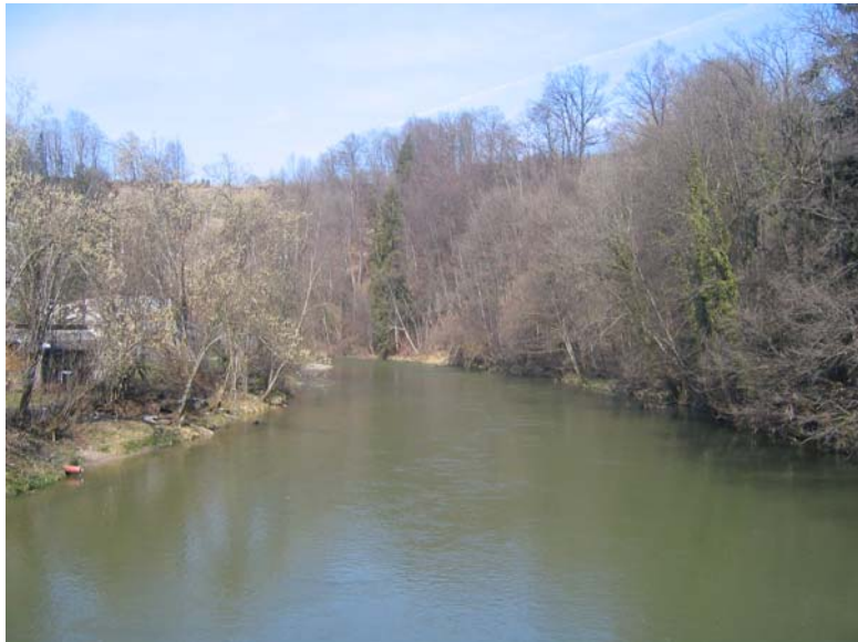
Foto Nr. 36: Abschnitt im Rückstau der Schwelle Rechensteg, Blick aufwärts: Strukturhöhung entlang Aussenkurve mit lokal gewonnenen Raubbäumen