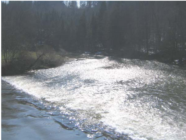
Foto Nr. 35: Die Schwelle unterhalb des Rechensteges bildet ein Aufstiegshindernis in der Sitter: Entschärfung / Sanierung im Zusammenhang mit Neubau KW