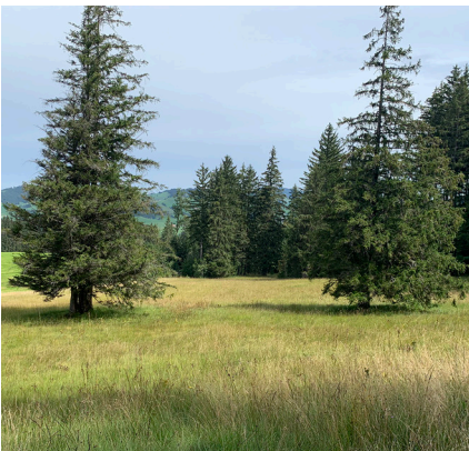
Schutzgebiet Kau, Appenzell AI.