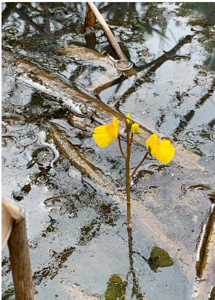
Wasserschlauch im Kaltbrunner Riet.

Thema: Naturschutz im Kanton St. Gallen – Ziele, Entwicklungspotenzial und Strategie