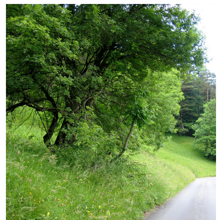
Schutzgebiet Wiesenrank, Wartau SG.

Das Gebiet Wiesenrank liegt an südexpozierter, über 18% geneigter Hanglage zwischen einer Strasse und angrenzendem Wald. Dieser bewahrt die Fläche vor Einflüssen aus intensiv genutzten Wiesen. Ein kleiner Bach vernässt einen kleinen Streifen entlang des Wasserflusses und bereichert somit das Kleinlebensraumangebot. Zudem befinden sich drei einzelne, erhaltenswerte Baum- und Buschgruppen auf der Parzelle. Daher hat Pro Natura St. Gallen-Appenzell für dieses Schutzgebiet den Erhalt der Magerwiese und des Gehölzbestandes als Oberziel definiert.