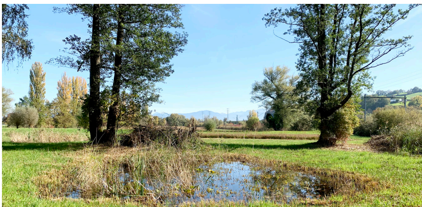
Schutzgebiet Buriet/Buechsee, Thal.

Schutzgebiete mit vakanter Betreuung. Nähere Infos zum jeweiligen Schutzgebiet finden Sie unter «www.pronatura-sg.ch/unsere-naturschutzgebiete». Gehen Sie ungeniert und unverbindlich auf unsere Geschäftsstelle zu, falls Sie Interesse an der Betreuung eines Schutzgebiets haben: «info-sga@pronatura.ch».