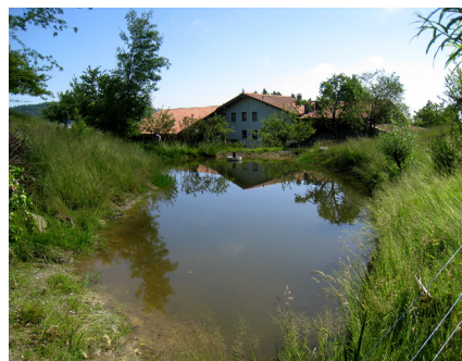
Schutzgebiet Moos, Obereggi AI.

Die Schutzgebietsbetreuung ist für die Kontrolle des Allgemeinzustandes verantwortlich (Beschattung, Verlandung, Neophyten) und hält dabei den Kontakt zum Grundbesitzer der Parzelle sowie zum NVVO, der das Gebiet pflegt. Bei Bedarf kann der NVVO beim Schutzgebietsunterhalt auf die Beratung durch die Schutzgebietsbetreuende zurückgreifen. Sie fasst mindestens einmal pro Jahr eine Kontrollmeldung an die Geschäftsstelle.