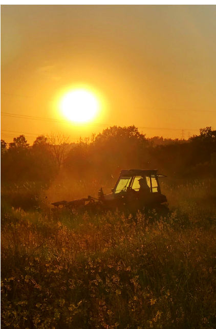
Mahd im Kaltbrunner Riet.